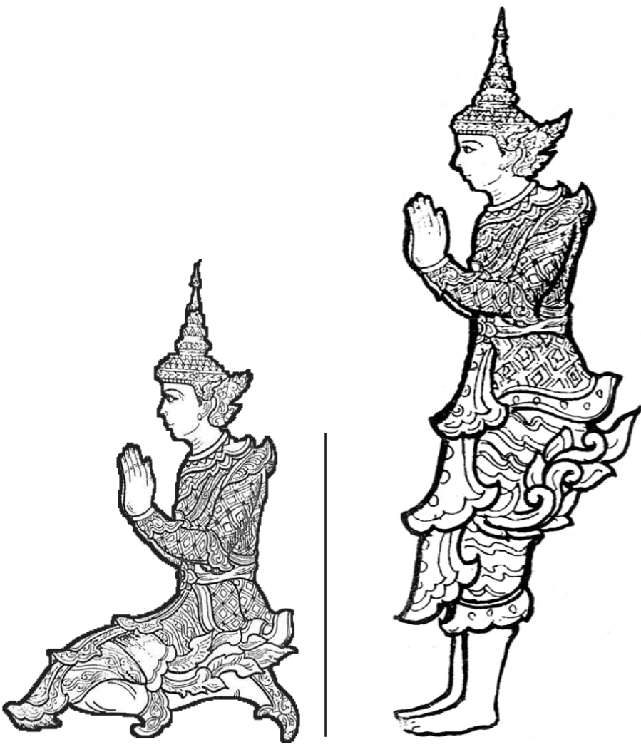
တေရဋ္ဌနတ်မင်း (အရှေ့အရပ်)

မိမိတို့ မြို့ရွာတွင် အထက်ပါအစီအစဉ်အတိုင်း စီစဉ်ရန်အတွက် အခက်အခဲ ရှိပါက ပညာဗဟုသုတပြည့်စုံသော ဆရာတော်ကြီးများက မိမိတို့ မြို့ရွာ တန်ခိုးကြီးဘုရားပရိဝုဏ်အတွင်း အာရုံခံတန်ဆောင်းတို့၌ နေရာခင်းကျင်းစီမံ၍ ရွတ်ပွားနိုင်ကြောင်း သြဝါဒပြု မိန့်ကြားကြပါသည်။