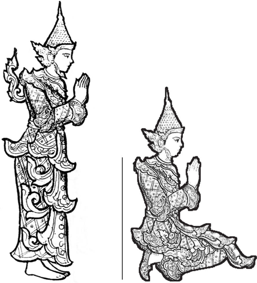
သိကြားမင်း