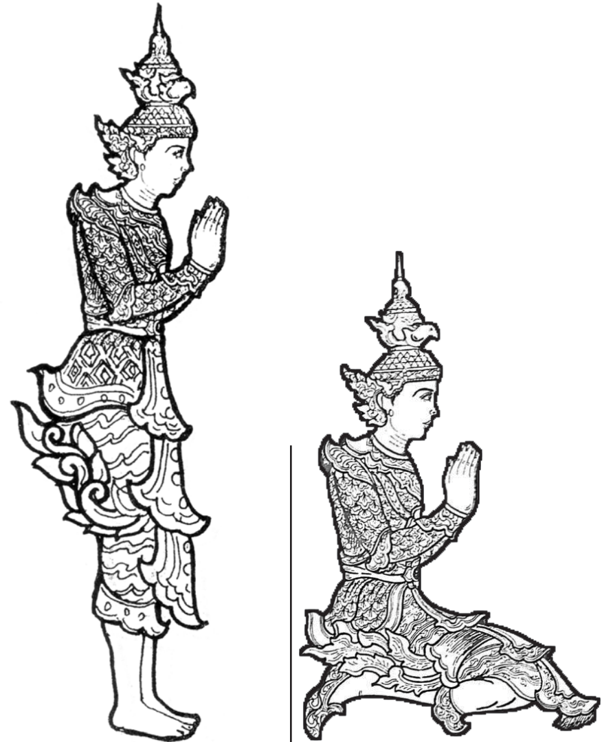
ဝိဇ္ဇာဇကနတ်မင်း (တောင်အရပ်)